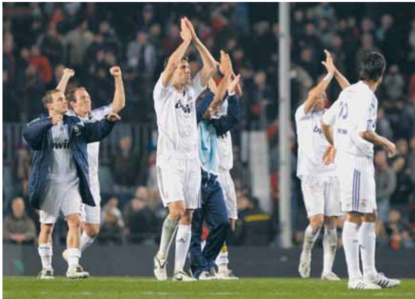
Los brazos al cielo de Barcelona