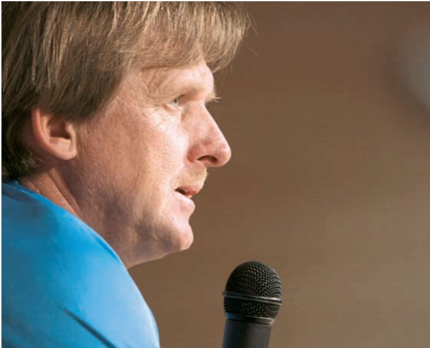
Schuster verá cumplido su deseo de entrenar al Real Madrid y tendrá el reto de mejorar el juego del vigente campeón de Liga