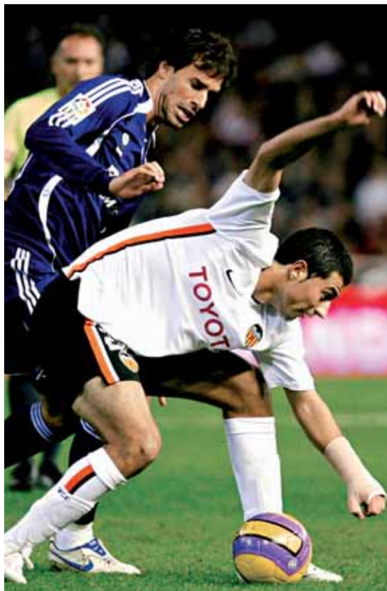
Van Nistelrooy no marcó en Mestalla, pero es un seguro a domicilio

El presidente del Real Madrid no frena. Y aprovecha cada salida para reunirse con los peñistas. Esta ocasión fue en Valencia donde transmitió su mensaje. "Este año iremos a La Cibeles", dijo, y, haciendo balance de los cinco meses que lleva al frente del club, reconoció que "la Junta Directiva" está "trabajando con muchas dificultades"; por lo que admitió que "hacemos lo que podemos, ya que no es sencillo reconstruir el equipo". Alabó el "orden, la tranquilidad y la unidad" conseguida con Capello y prometió que Gago e Higuain llegarán porque trabaja "para rejuvenecer al equipo".