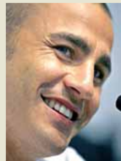
Cannavaro, el central elegido

Pendientes del descenso. La llegada de Zambrotta, Cannavaro y Emerson parece cercana. Sin embargo, falta un fleco, quizá el más importante: la resolución judicial, que podría anunciarse esta misma semana.