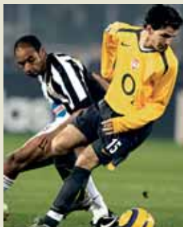
La llegada de Cesc se complica

Pedja Mijatovic trabaja contrarreloj. El director deportivo del club blanco cuenta con dos semanas como máximo para satisfacer todas las peticiones de Fabio Capello. El objetivo prioritario es que los fichajes participen del stage en tierras austriacas, aunque en el seno del club se es consciente de que algunas de las incorporaciones podrían cerrarse en vísperas del inicio de la Liga.